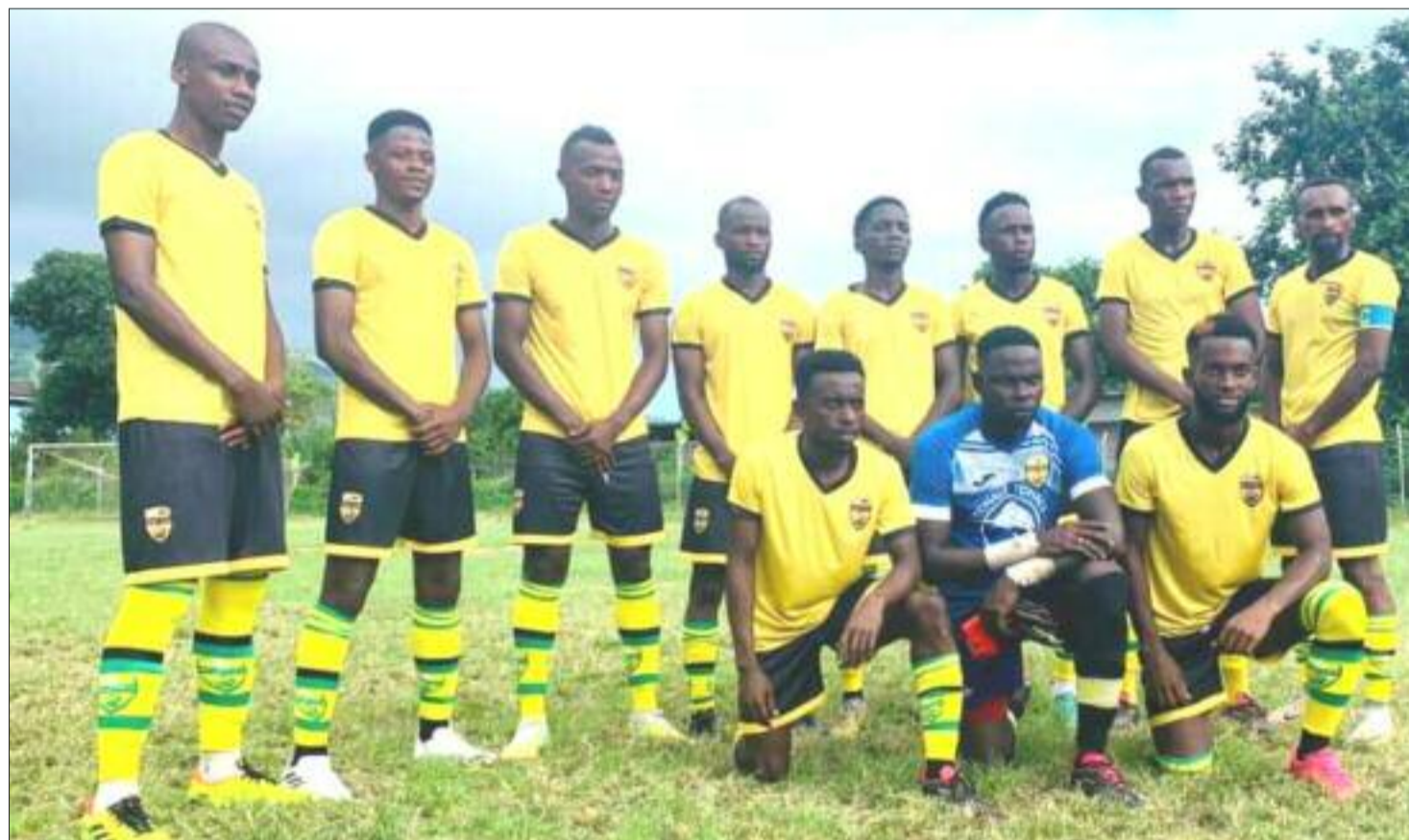
Salimani avant d'affronter ses voisins de Nyumadzaha, hier 8 novembre (Mouzawar Abdallah)

protégés de Soumeith Ahmed Ali vont recevoir le Fc Male.