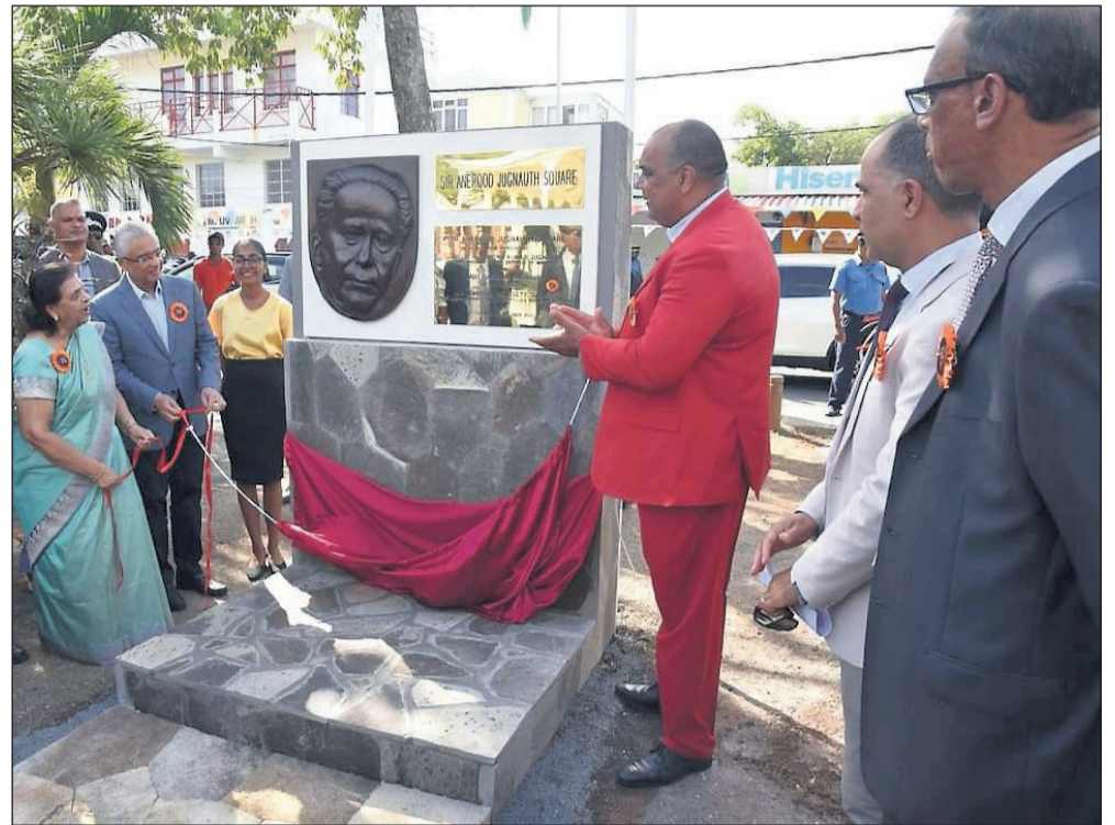
Le square Anerood Jugnauth a été inauguré mardi à Port-Mathurin.

Quant à Anerood Jugnauth, surnommé «le père du développement économique» en parvenant à sortir Maurice du marasme, il avait milité pour l'autonomie rodriguaise en se basant sur l'exemple de Trinidad-et-Tobago lorsqu'il avait partagé le pouvoir avec Paul Bérenger, le leader du Mouvement militant mauricien (MMM). Son fils Pravind Jugnauth l'a rappelé au cours de la cérémonie, profitant également de son séjour à Rodrigues pour proposer une réforme du système électoral